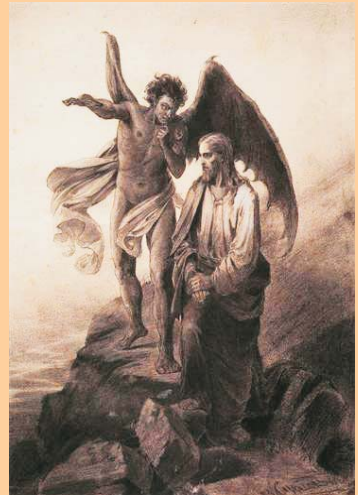
Temptació de Crist, de Vasily Surikov, 1872

El diable no pot amb Jesús, però tornarà a Getsemaní, al procés del Sannedrí, a la Creu... No és gens fàcil per a Jesús.